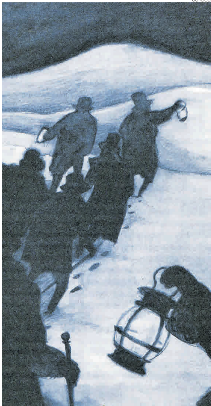
Una de las ilustraciones del libro.