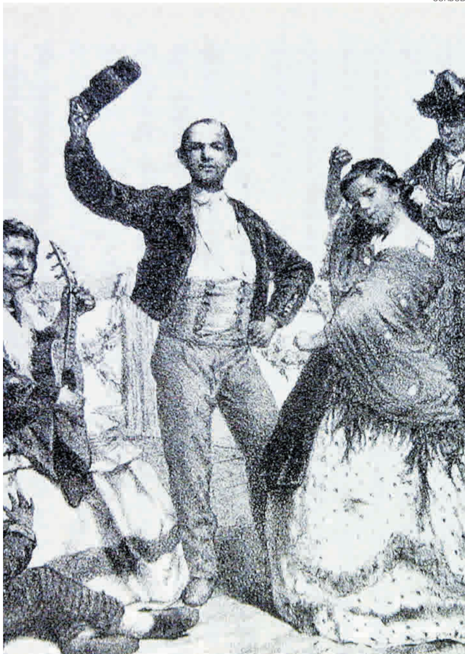
Fiesta gitana en Córdoba, en una imagen del siglo XIX.

A pesar de las expectativas de la Ley Moyano de 1857, por la que se implantaba la