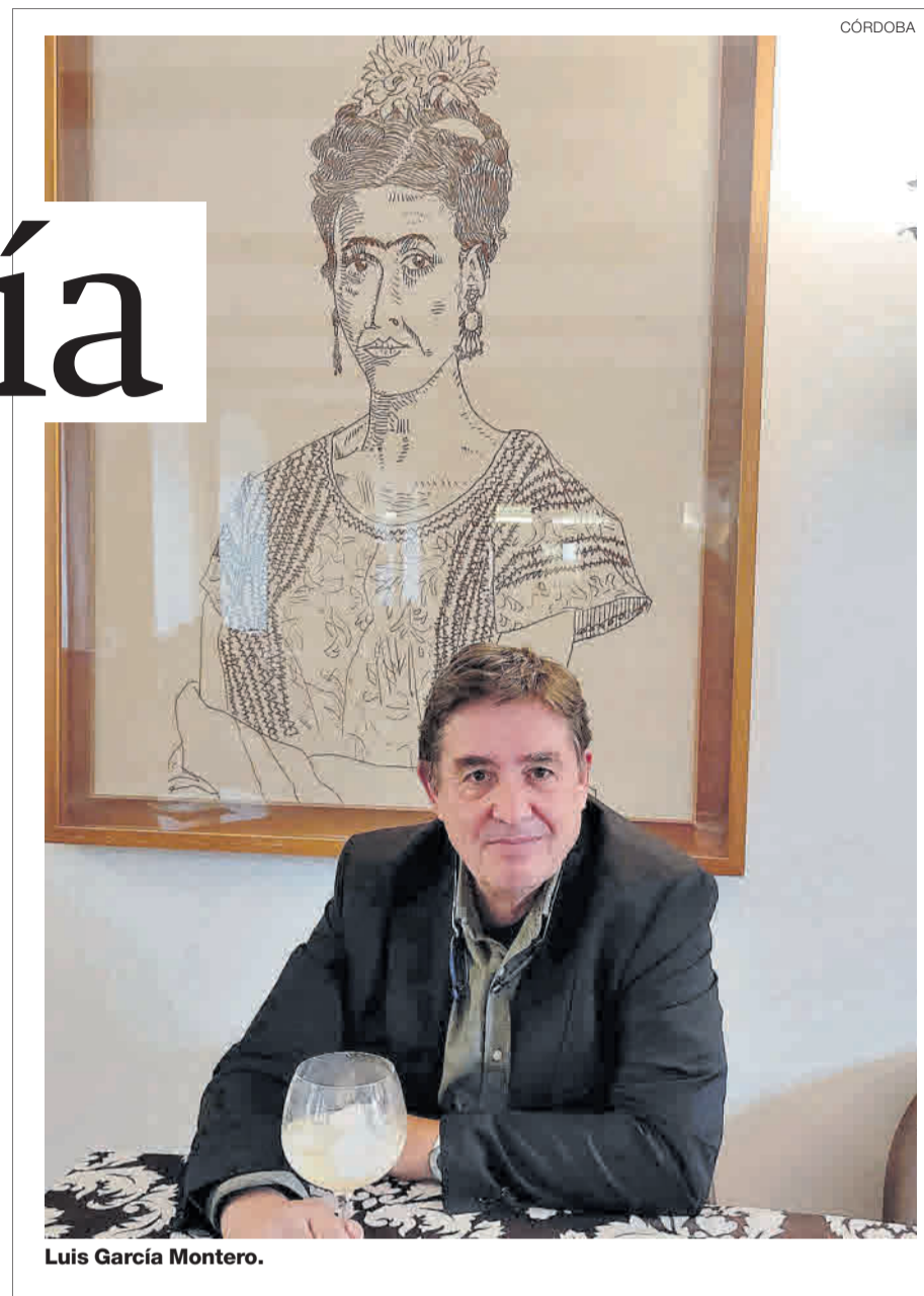
Luis García Montero.

- Yo me eduqué en un momento donde la actividad cultural reconocía su dimensión política. Fíjate, entro en la Universidad y me siento heredero de todo lo que había sido la lucha cultural contra el franquismo. He hablado de Blas de Otero, de la generación de la primera posguerra, de José Agustín Goytisolo. En la segunda posguerra, mis maestros poéticos (José Agustín, Ángel González, Jaime Gil de Biedma) se habían reunido en el 59 para recordar los 20 años de la muerte de Antonio Machado en Colliure y viajaron a Colliure a recordar el exilio de Machado y su muerte 20 años antes. Hablar de todos ellos tenía una dimensión política. Las relaciones de la cultura con la sociedad, la responsabilidad del escritor a la hora de mantener su conciencia y aceptar los posibles efectos. Reivindico mucho la poesía, entre otras cosas, porque creo que los seres humanos nacemos en sociedad. Porque no es lo mismo haber nacido en Granada en el año 58 que haber nacido en Afganistán en 2013. No es lo mismo, lo que dice mi hija, cuando dice «Soy mujer» y es una chica que nació en 1997, que lo que decía mi abuela que nació en mil novecientos poco. Los sentimientos son también históricos y en ese sentido, la dimensión de la intimidad tiene un efecto social y, por eso, creo que los individuos tenemos una dimensión cívica que es po-